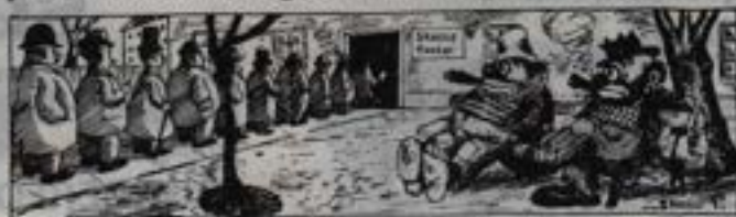
- De - Kastner! Se der... at de gider!

Den skattefri opsparing og de skattefrie renter bliver til en betydelig formue, som kan udbetales kontant, når man er fyldt 60 år. Og til den tid skal der kun betales 25% i statsafgift. Man sparer i skat nu og sikrer levestandarden i fremtiden - også hvis man ønsker at trække sig tilbage allerede som 60-årig. En Kapitalpension i Sparekassen kan oprettes af alle privatansatte lønmodtagere - efter aftale med arbejdsgiveren.